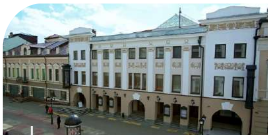
Казанский государственный большой академический драматический театр имени В.Качалова

Kazan State Academic Bolshoi Drama Theatre named after V.Kachalov