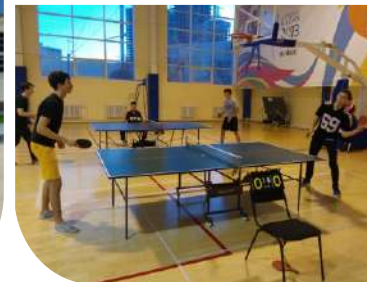
Спортивный комплекс "Итиль" "Itil" Sports Complex