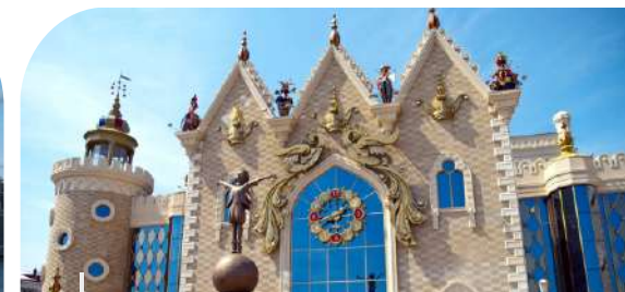
Татарский государственный театр кукол "Экият"

Tatar State Academic Theater named after G. Kamal