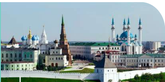
Музей-заповедник "Казанский Кремль" Museum-Reserve "Kazan Kremlin"