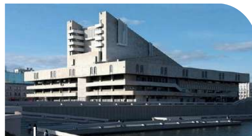
Татарский государственный академический театр имени Г.Камала

Kazan State Academic Bolshoi Drama Theatre named after V.Kachalov